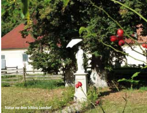
Statue vor dem Schloss Loosdorf

nicht möglich, aber interessante Erkundung rundum: Außenschau, Wassergraben, Baumschule). Anschließend auf der Zufahrt links raus zur Landstraße, kurz rechts und links an Wirtschaftsgebäuden vorbei in die Felder. An einer Baumreihe entlang und mit ihr weglos links abzweigen Richtung Weißenberg . Unterwegs links durch zu einem Feldweg und auf diesem hinauf zur großen Aussichtswarte kurz nach einer Kreuzung (Blick zu den Leiser Bergen, ins Laaer Becken, Staatzer Klippe, Pollauer Berge, AKW Dukovany in Tschechien). 1 Std.