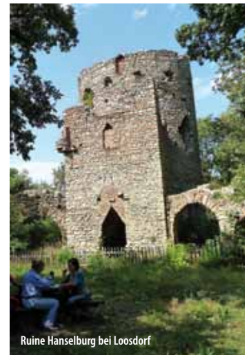
Ruine Hanselburg bei Loosdorf

Haken nach links zum Pkt. 346 m, dort ein Haken nach rechts zur nächsten Stempelstelle. Abkürzungsmöglichkeit geradeaus zum nahen Piattikreuz (siehe Karte) und weiter wie unten. Von der Stempelstelle weiterhin auf die rote Mark. konzentriert links haltend abwärts. Dann rechts über einen ehem. Wassergraben der lohnende, kurze Abstecher zur Ruine Hanselburg (Rastplatz). 1 ½ Std. Retour zur Abzweigung und rechts weiter in einem Hohlweg zur Landstraße. Kurz rechts, gleich wieder links ab (ab nun wieder blaue Mark.) in eine Senke, am Feldrand entlang, wieder in den Wald und in einer weit ausholenden Rechtsschleife aufwärts. Dann links raus zum Waldrand (Stempelstelle und Hochstand, Pkt. 324 m). Nun die Mark. verlassend gerade raus in die Felder, rechts hinab nach Hagenberg und gerade zur Kirche. Dort links, die Hauptstraße kreuzen und die nächste Möglichkeit rechts zum Schloss (Besichtigung