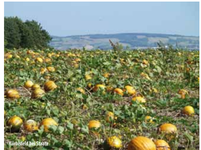
Kürbisfeld bei Staatz

Auf der Zufahrt zurück und nach dem gepflegten Nebengebäude links zu einer kleinen Waldlichtung (Friedhof, Kriegerdenkmal, Marienfigur). Mit der blauen Mark. zu nahen Wirtschaftsgebäuden, zwischen diesen durch und direkt am Waldrand rechts auf einem Feldweg hinauf zum unscheinbaren Piattikreuz . Unmittelbar davor links in den schönen Eichenwald und immer der blauen Mark. folgen (Richtungsänderungen!), zuletzt ein kurzer steilerer Abschnitt mit Geländer zur nächsten Stempelstelle. Dann im Talboden nach links eindrehend bald raus in die Felder, vorbei an einer Pferdekoppel, dann am ehem. Hotel Auhof. In Wultendorf geradewegs zum Dorfplatz und rechts über einige Stufen zur Kirche. Dahinter immer noch mit blauer Mark. ansteigend zur Kapelle auf dem Wachtberg und auf einen kürzlich errichteten schönen Aussichtspunkt (Infotafeln). Dann ohne Mark. auf Asphalt weiter zu einem Bildstock. Dort links und sogleich rechts an einem Grünstreifen entlang in eine Senke und jenseits zu einem Kreuz. Rechts am Waldrand aufwärts und noch vor dem Sender links auf den Staatzer Rundwanderweg abzweigen. Durch Weinberge, dann durch Felder hinab zu einem Reithof, links zur Landstraße, rechts nach Staatz und von der Hauptstraße rechts Richtung Kellergasse Schlichtenberg zurück zum Ausgangspunkt „Am Hufeisen“. 1 ¼ Std.